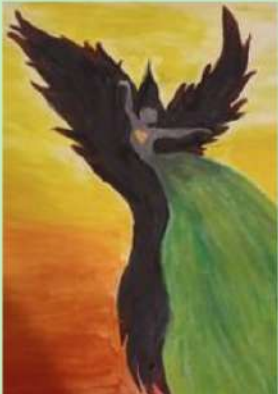
Piešė - Aida Mažikaite