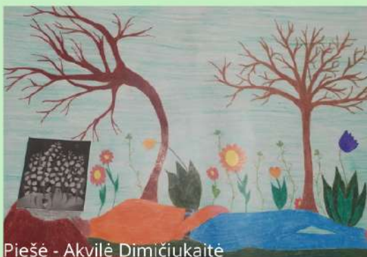
Piešė - Akvilė Dimičiukaitė