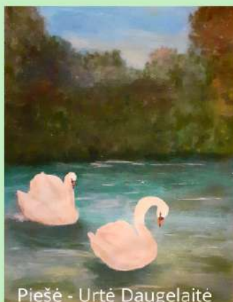
Piešė - Urtė Daugelaitė